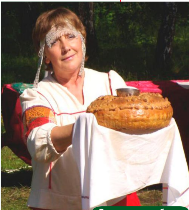
Встречаю с любовью