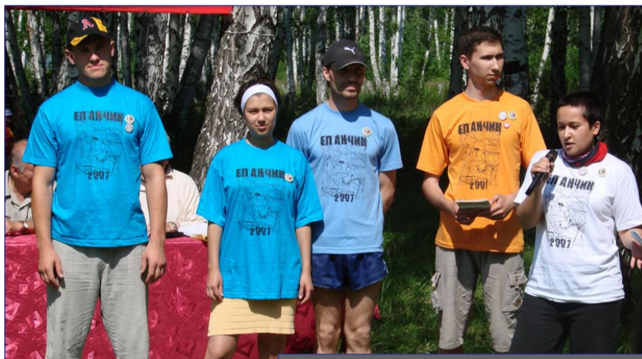
Молодежный союз «Стратегия будущего»