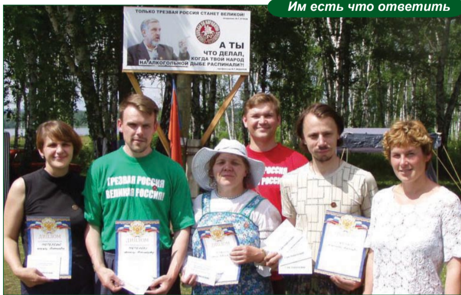
Им есть что ответить

Ну и главное отличие – неожиданность – это соседи. Рядом с нашим лагерем располагался лагерь православных следопытов. Больше сотни детей