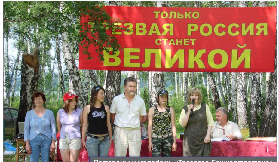
Ветераны и молодежь «Трезвого Башкортостана»

о широком спектре работы клуба: от уроков трезвости в школах и дошкольных учреждениях до оказания практической помощи людям в освобождении от наркомании и дальнейшей их реабилитации.