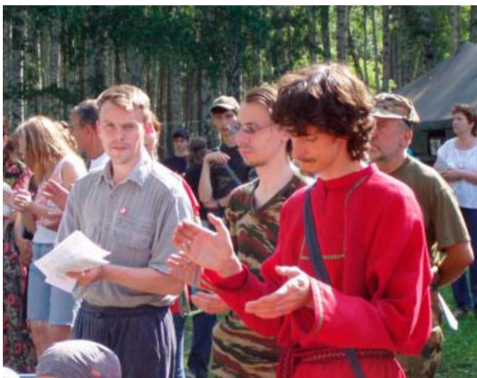
Новые члены координационного совета