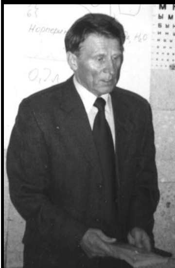
Светлая ему память!