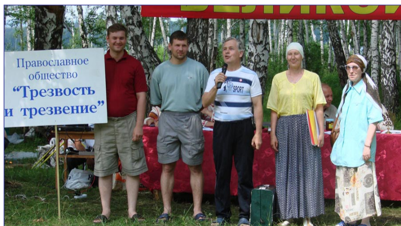
«Трезвость и трезвение» из Тюмени

Делегация братства трезвости храма Александра Невского из Нижнего Тагила в этом году была представлена женско-девичьем составом (кадеты и их руководители,