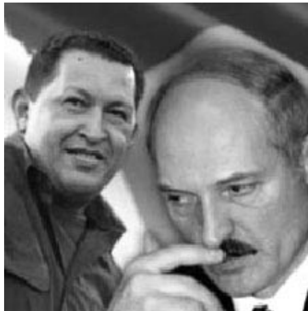
Так оно задумано, но не значит, что так получится.

Дело идёт к воплощению завещанного паскудным талмудом и главой первого правительства Израиля по имени Бен-Гурион, предрекавшего время, когда евреи встанут во главе «мирового союза, и в их распоряжении будут международные полицейские силы. Все армии будут упразднены, и на земле не будет больше войн. Объединенные народы построят в Иерусалиме Ковчег пророков, и он станет местом, где будет восседать Высший суд человечества и разрешать все споры подвластных континентов».