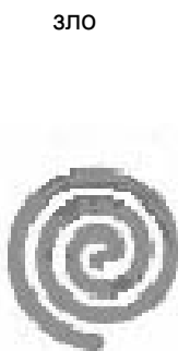
левый лабиринт подчинение соблазну, духовная смерть