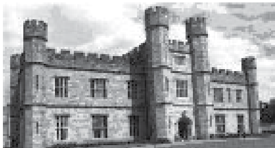
возможный вид музея трезвости: замок-лабиринт