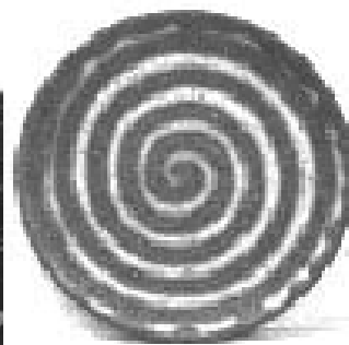
правый лабиринт борьба с соблазном, духовная жизнь